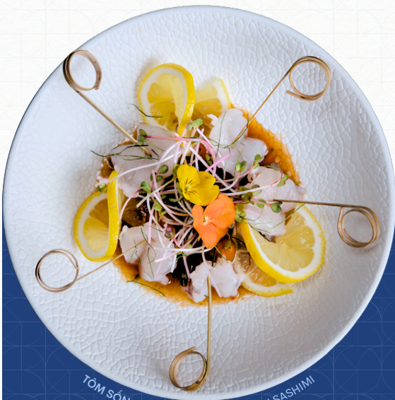
TÔM SỐNG SỐT THẢI | SPICY PRAWN SASHIMI