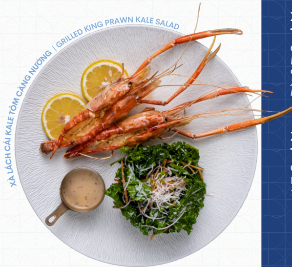
XÀ LÁCH CẢI KALE TÔM CÀNG NƯỚNG | GRILLED KING PRAWN KALE SALAD

River King Prawn, Kale, Sesame Sauce, Parmesan Tôm Càng, Cải Kale, Sốt Mè, Phô Mai Bột