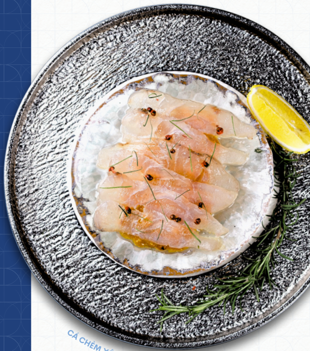
CÁ CHÈM XÔNG KHÓI | SMOKED SEABASS