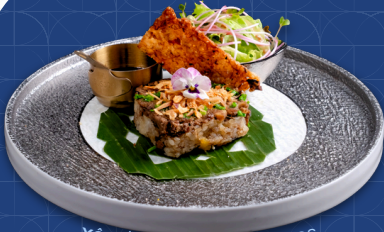
XÔI BÒ CÂU | PIGEON CAMPOS