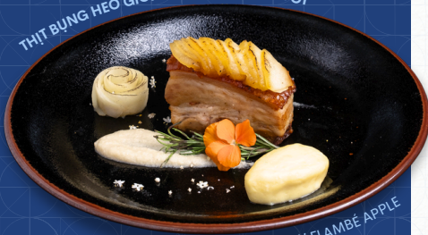
CRISPY PORK BELLY W FLAMBÉ APPLE