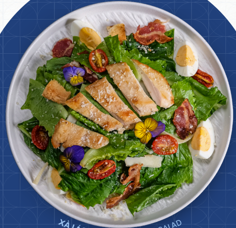
XÀ LÁCH ỨC GÀ | CAESAR SALAD

Aging Duck Breast, Mango, Lychee, Plum Sauce Ức Vịt Ủ Khô, Xoài, Trái Vải, Sốt Mận