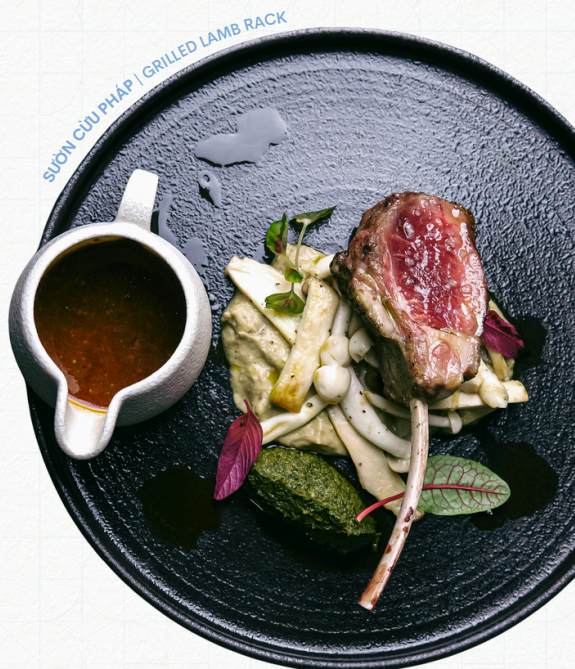
SƯỜN CỪU PHÁP | GRILLED LAMB RACK

Tất cả giá trên được tính bằng "1000 VND", chưa bao gồm 5% phí dịch vụ và thuế GTGT theo quy định