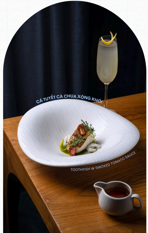
CÁ TUYẾT CÀ CHUA XÔNG KHÓI

All prices are quoted in "1000 VND" and subject to 5% service charge and current government tax