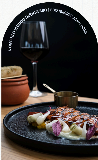
NHONG HEO IBERICO NƯỚNG BBQ | BBQ IBERICO JOWL PORK